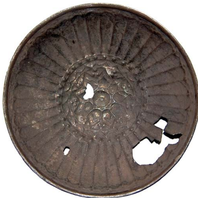
Рис. 1. Серебряный сосуд из погребения 164 Верх-Саинского могильника. Фото