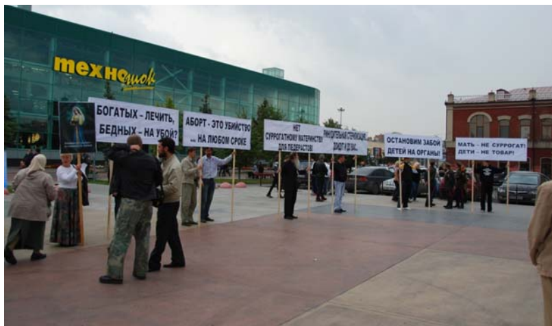
Рис. 3. Пикет ТГРК против принятия закона «Об охране здоровья», Тюмень, 30 августа 2011 г.

димостью людей. На акции приносятся многочисленные плакаты, стенды и столы с информацией о мероприятии (листовки, газеты, значки), участники используют различную атрибутику — имперские ленточки и футболки, казачью форму (рис. 3).