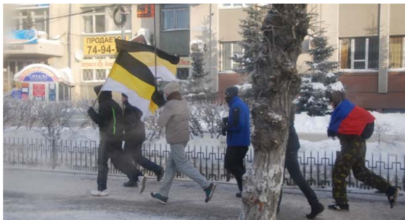
Рис. 4. Первая «русская пробежка» в Тюмени, январь 2011.

в два раза. Увеличилась используемая атрибутика: имперские флаги, новые флаги с надписями «Русские пробежки. Тюмень», футболки «Бог с нами», «Слава России! За веру! Царя! Отечество!», «Славянин», «Тренируй тело — береги душу».