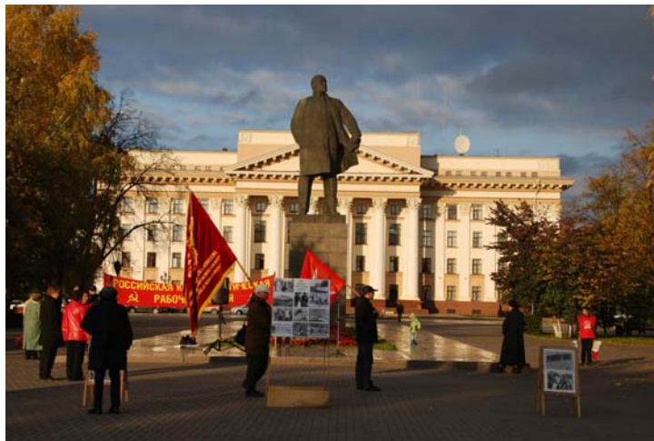
Рис. 2. Митинг, посвященный памяти защитников Белого дома, Тюмень, 3 октября 2011 г.

В целом репертуар РКРП и аффилированных с ним организаций направлен скорее на поддержание мобилизации сторонников, нежели на последовательное оспаривание власти или воздействие на широкую аудиторию. Репертуар носит, по большому счету, ритуализированный характер, что отражается в том числе в выборе мест проведения: у памятника В.И. Ленину, на площади Борцов революции (рис. 2). Интенсивность и однообразие акций, с одной стороны, позволяют поддерживать связи среди сторонников и активистов, а также быть узнаваемыми в масс-медиа, но с другой — ведут и к отторжению со стороны широкой публики.