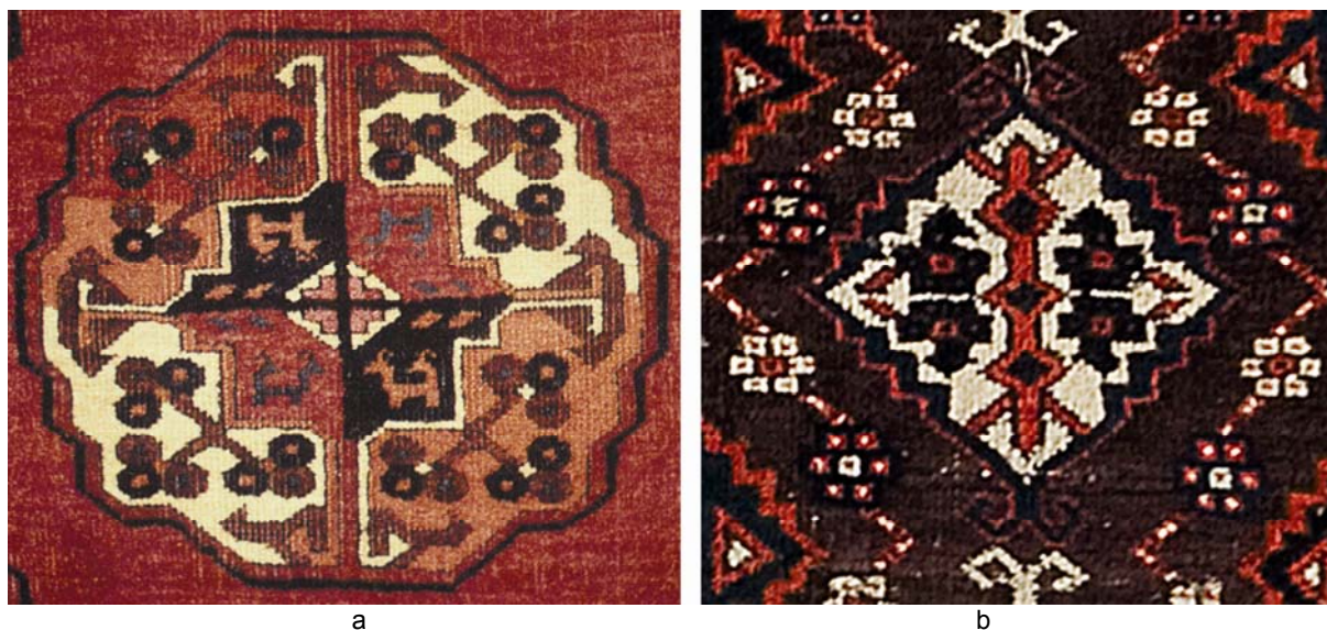
Рис. 4. Салор-гэль (а) и чоудор-гэль (b)

Раздел рассматривает такую ранее не разрабатывавшуюся другими авторами тему, как художественные особенности гёлей как маркеров территориальной и конфедерационной принадлежности изготовителей. Для наглядности рассматриваются такие наиболее «чистые» варианты, как постилочные халы салоров и чоудоров (рис. 4).