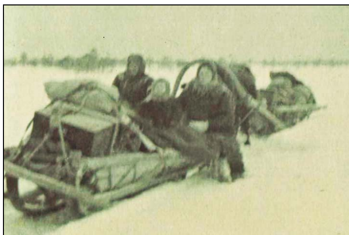
Рис. 2. Подводы на Туртасском зимнике, первая половина XX в. (из семейного архива Доброванова С.С.)

Как правило, переезд переселенцев в тайгу осуществлялся в несколько этапов. Предварительно нужно было определить место будущего поселения, расчистить территорию от леса, построить дом и хозяйственные постройки (включая пригоны и стойла), заготовить корм для скота — этот этап мог занять от нескольких месяцев до нескольких лет. Далее, в зимний период, следовало совершить несколько поездок, чтобы доставить гужевым транспортом необходимые вещи и запас продуктов (рис. 2). Только после этого завозили членов семьи и вели скот. Из рассказов переселенцев: «Брат наш завозил. Он эти — продукты... до нас, мы еще не собрались, а он два раз за зиму и до этого продукты завез. По сколько-то там, на двух лошадях. 27 марта мы пришли. Мы же с коровами — на лошадях и с коровами приехали. Две коровы вели. Тогда у местных у всех лошади были дак, они подъезжали часто рыбу продавать, ягоды ли что — тогда дорога хорошая была. Я почти всю дорогу бежал» [Сводные материалы...].