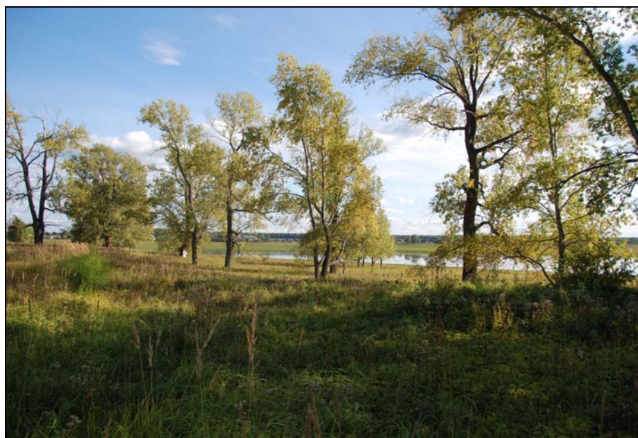
Рис. 2. Вид на раскоп С.Г. Пархимовича 1982 г., заложенный на восточной оконечности Карачинского острова.

Карачин остров изучался рекогносцировочно в 1982–1983 гг. С.Г. Пархимовичем, которому местные жители рассказали о распаханных землянках Ермака внутри дуги озера. Он заложил три небольших раскопа на восточной оконечности острова и установил площадь русского поселения в 1–1,5 га, датировав его концом XVI — началом XVII в. (рис. 2). В 1982 г. им было изучено наземное срубное жилище, в котором найдены древесина, остатки печи, фрагменты слюдяных окон, оружие, бытовые вещи, обугленные зерна, медная монета, стеклянная бусина; лепная посуда местного производства, русская гончарная керамика, сходная с найденной в Лозьвинском городке, функционировавшем всего девять лет в конце XVI в. [Пархимович, 1984, с. 169]. Жилище просуществовало недолго и было сожжено. В 1983 г. С.Г. Пархимовичем обнаружена рекогносцировкой глубокая землянка с удовлетворительной сохранностью нижних венцов бревен от стен, с печью, обмазанной глиной. В заполнении найдены обломки русской мореной керамики, кости животных [Пархимович, 1985, с. 236]. Однако получить основания для более точного датирования не удалось [Пархимович, 1986, с. 142], поэтому вопрос о связи обнаруженного на Карачинском острове поселения, названного исследователем «Карачин городок», поскольку он отождествил его также с городком Карачи, с летописными событиями остается открытым.