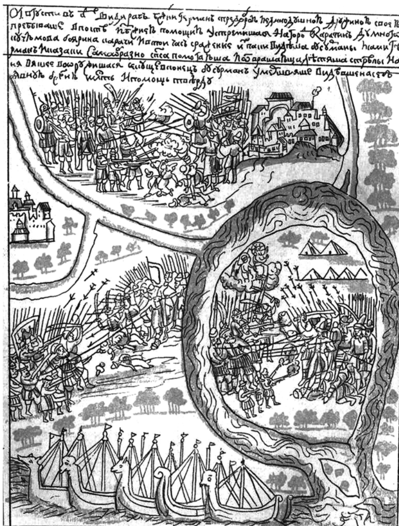
Рис. 3. Рисунок боя при Карачинном городке из Ремезовской летописи.