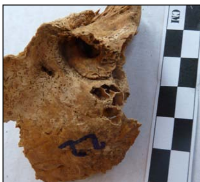
Рис. 2. Мастоидит. Материал из могильника Багери Чала (п. 22, ребенок 8–9 лет).

У индивида обнаружены два проникающих в полость черепа отверстия. Операции были сделаны при жизни. В области сагиттального шва следы иссечения фрагмента кости (рис. 1, А). Этот метод трепанации называют поперечным распилом или линейным разрезом [Buikstra, Ubelaker, 1994; Verano, 2003, p. 525–530]. На теменных костях четко видны места разрезов. Размеры отверстия на внешней стороне 2 \times 15 \times 2(?) \times 15(?) мм. Экспертизой выявлено у ребенка в нижней левой части теменной кости второе отверстие (рис 1, Б). Отверстие имеет диаметр 16 \times 9 \times 16(?) \times 9(?) . Следы явного воспалительного процесса в области трепанации отсутствуют. Входные края отверстия ровные, острые, без следов заживления.