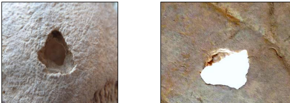
Рис. 12. Отверстие треугольной формы. Материал из могильника Карашамб (п. 2, ♂ 40–45 лет).

На левой теменной кости индивида из погребения 2 (Карашамб, IX–VIII вв. до н.э.) обнаружено треугольное отверстие (рис. 12). Череп принадлежал мужчине, скончавшемуся в возрасте 40–45 лет. Свод черепа отчетливо долихокраний, форма сфеноидная. Наименьшая ширина лба у погребенного средняя, наибольшая — малая, а ширина затылка — большая. Из генетически наследуемых маркеров у данного индивида фиксируются: foramina supraorbitalia (слева), os wormii suturae lambdoidea , canalis condyloideus .