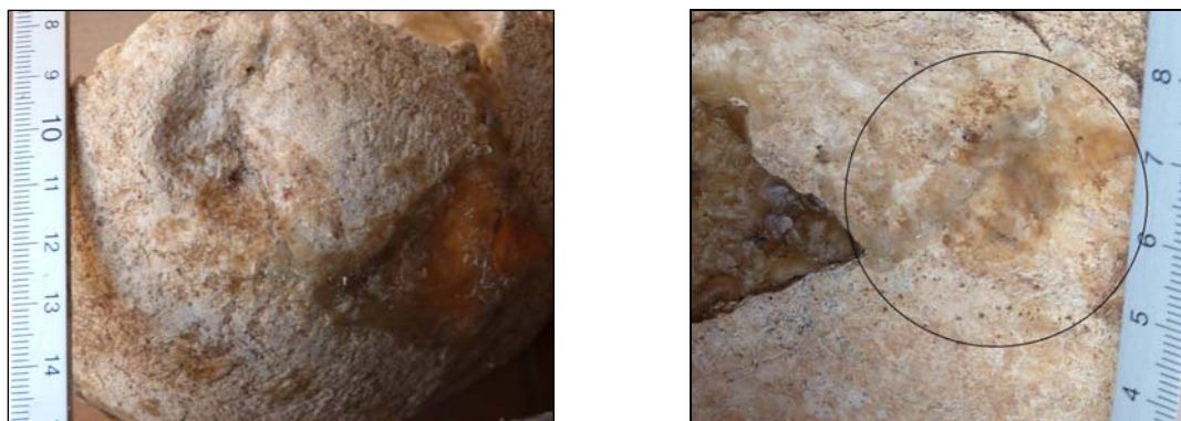
Рис. 14. Поверхностная трепанация. Материал из могильника Бовер (п. 7, ♂ 35–40 лет).

На черепе мужчины зрелого возраста из погребения 7 могильника Бовер (X–IX вв. до н.э.) имеются следы символической трепанации (рис. 14). Череп характеризуется общей грациальностью строения, слабо выраженным рельефом в области надбровья. Строение черепа мезокранное, ширина затылка большая. На черепе выявлены следующие дискретно варьирующиеся признаки: os postsquamosum , foramina parietalia , os asterion , sutura incisive , отсутствие foramina spinosum , sutura mendosa . У индивида восточных признаков зубной системы не фиксируется.