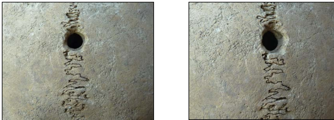
Рис. 13. Трепанационное отверстие. Материал из могильника Кармир (п. 1, ♀ 25–30 лет).

поражающая преимущественно кожу и нервную систему (периферические нервы), реже внутренние органы. Данная операция, возможно, имела лечебное значение. На затылочной кости с правой стороны имеется остеома (9×9 мм). Следует отметить, что на поселении Ашиглы Гуюк был обнаружен женский череп со следами трепанации [Açikkol et al., 2009], относящийся к эпохе неолита. Операция, так же как в Кармире и Чалангантепе (Дашкесанский район), проведена методом сверления. Ю.С. Эрдел и А.Д. Эрдел [Erdal Y.S., Erdal O.D., 2011, p. 511–513] зафиксировали пять случаев сверлильной трепанации, относящихся к раннему железному веку. Во всех случаях операция была сделана прижизненно и индивиды после нее жили некоторое время.