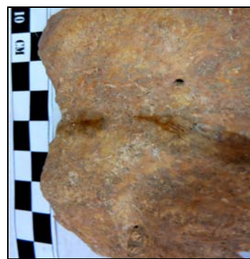
Рис. 3. Абсцесс головного мозга. Материал из могильника Багери Чала (п. 22, ребенок 8–9 лет).

У индивида фиксируется поротический гиперостоз в области птериона. Признак чаще всего ассоциируются с железodefицитной анемией, которая развивается при хроническом течении инфекционных и паразитарных заболеваний. У ребенка также обнаружены острое гнойное воспаление тканей сосцевидного отростка височной кости (мастоидит) (рис. 2) и абсцесс на затылочной кости (рис. 3). При мастоидите бактерии проникают из среднего уха в ячейки сосцевидного отростка, где воспаление приводит к разрушению костных структур [Nussinovitch et al.,