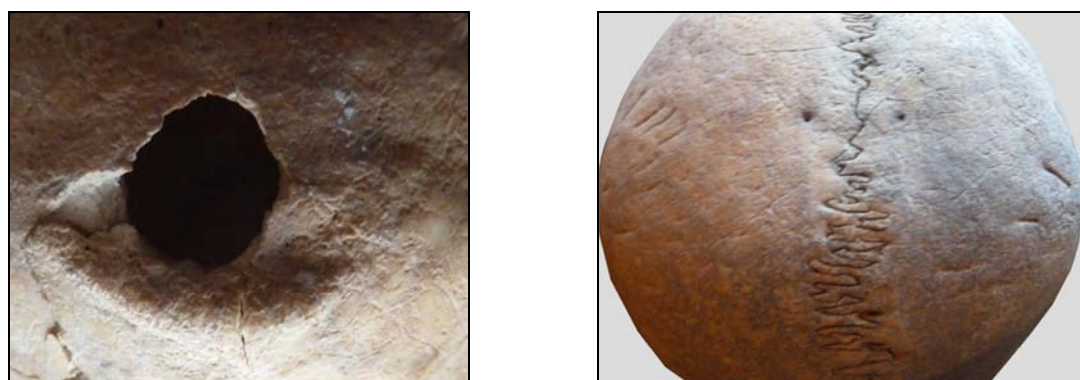
Рис. 11. Трепанационное отверстие на затылочной кости и поверхностные рубцы на теменных костях. Материал из могильника Карашамб (♂ 20–25 лет).

В этой же краниологической коллекции (Карашамб, IX в. до н.э.) следует выделить череп из раскопок 1985 г. Мужчина скончался в возрасте 20–25 лет. Череп небольших размеров, свод отчетливо долихокраний. Наименьшая ширина лба средняя, длина основания черепа маленькая, а лица — средняя. На черепе выявлен метапический шов. Из генетически наследуемых маркеров также отмечены буккостиль на верхних молярах (т.е. дополнительный бугорок стилоидного типа на вестибулярной поверхности параконуса), os wormii suturae squamosum , os wormii suturae lambdoidea , foramina mastoidea (на шве), foramina spinosum (отсутствие), foramen parietale , canalis condyloideus , canalis hypoglossi bipartite .