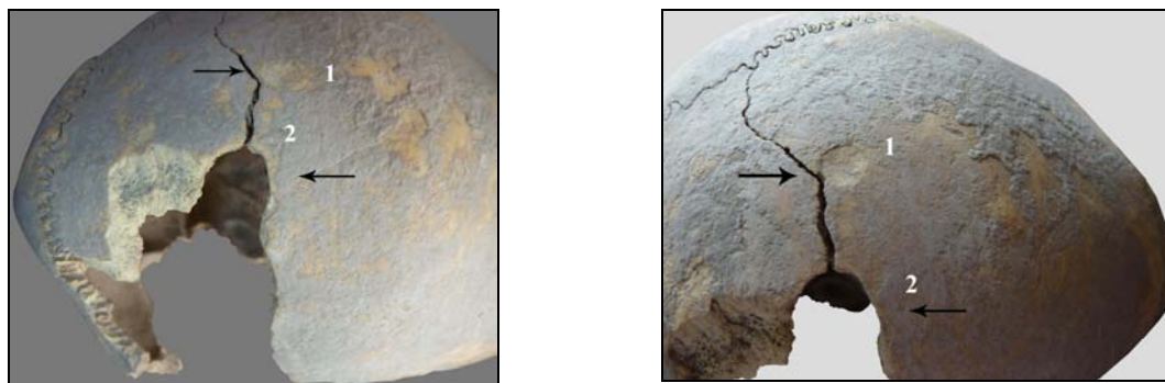
Рис. 10. Трепанация несквозная и проникающая. Материал из могильника Карашамб (п. 9, ♂ 18–20 лет).