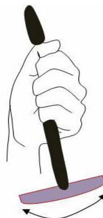
Рис. 5. Техника линейного разреза.

Следующая находка — из погребения 18 (Багери чала, X–IX вв. до н.э.). В погребении были обнаружены останки мужчины, биологический возраст которого определяется в пределах 30–40 лет. Долихокранное строение черепа, лоб узкий, лицо узкое, орбиты невысокие и неширокие, очень большая ширина и длина альвеолярной дуги. На черепе выявлены следующие дискретно варьирующие признаки: foramina infraorbitalia , os epiptericum , os postsquamosum , os wormii suturae coronalis , sutura palatina transversa (прямой), sutura incisive , foramina mentalia , foramina mandibularia . Одонтологический комплекс, свойственный индивиду, характеризует его как представителя «западного» одонтологического ствола. Практически полностью отсутствуют признаки восточного одонтологического ствола.