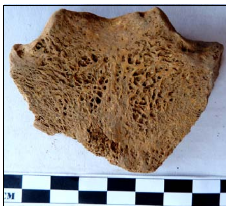
Рис. 6. Туберкулезные очаги на грудице. Материал из могильника Багери Чала (п. 18, мужчина 30–40 лет).

На черепе мужчины, на правой стороне теменной кости, обнаружены следы неполной операции (рис. 4). Операция проведена путем прорезания кости черепа инструментом, имеющим коническую форму (рис. 5). Отсутствуют следы травм на черепе. Предполагаемые размеры отверстия на внешней стороне 23,7×18,5×9,5×8,2 мм. Наблюдается трещина в области дефекта. Последствия для индивидуума — летальный исход.