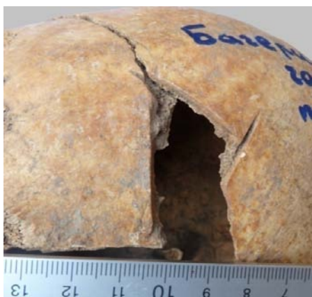
Рис. 4. Прижизненная трепанация черепа. Материал из могильника Багери Чала (п. 18, мужчина 30–40 лет).

2004]. Абсцесс мог возникнуть при остром гнойном отите. Можем предположить, что данная операция имела лечебное значение.