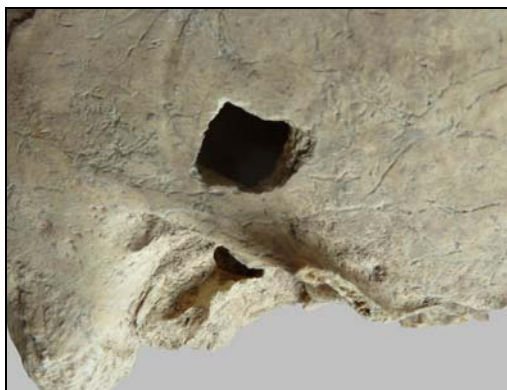
Рис. 9. Отверстие четырехугольной формы. Материал из могильника Кармир (п. 7, ♂ 55–60 лет).

В нашем распоряжении оказался трепанированный череп из могильника Кармир (IX–VIII вв. до н.э., п. 7). Череп принадлежал мужчине (55–60 лет), о чем свидетельствует выраженный мышечный рельеф на затылочной кости. Свод черепа отчетливо долихокраний, наименьшая ширина лба очень большая, наибольшая — средняя. Высота черепа и ширина затылка средняя. Из генетически наследуемых фенотипов у данного индивида фиксируются: foramina spinosum (отсутствие), foramen parietale , canalis condyloideus , canalis hypoglossi bipartite .