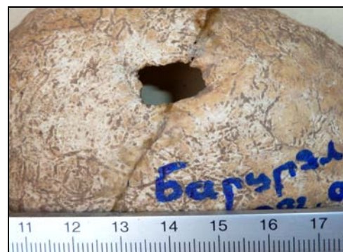
Рис. 8. Прижизненная трепанация черепа. Материал из могильника Барцрjal (п. 9, 40–50 лет).

Эмалевая гипоплазия , обнаруженная на клыках и премолярах, позволяет считать, что в возрасте от 6 мес. до 10 лет индивид перенес сильный физиологический стресс (недоедание, наблюдался дисбаланс в рационе питания и т.д.) [Goodman, Rose, 1990]. Кроме этого, в результате исследования было выявлено острое гнойное воспаление тканей сосцевидного отростка височной кости (мастоидит) .