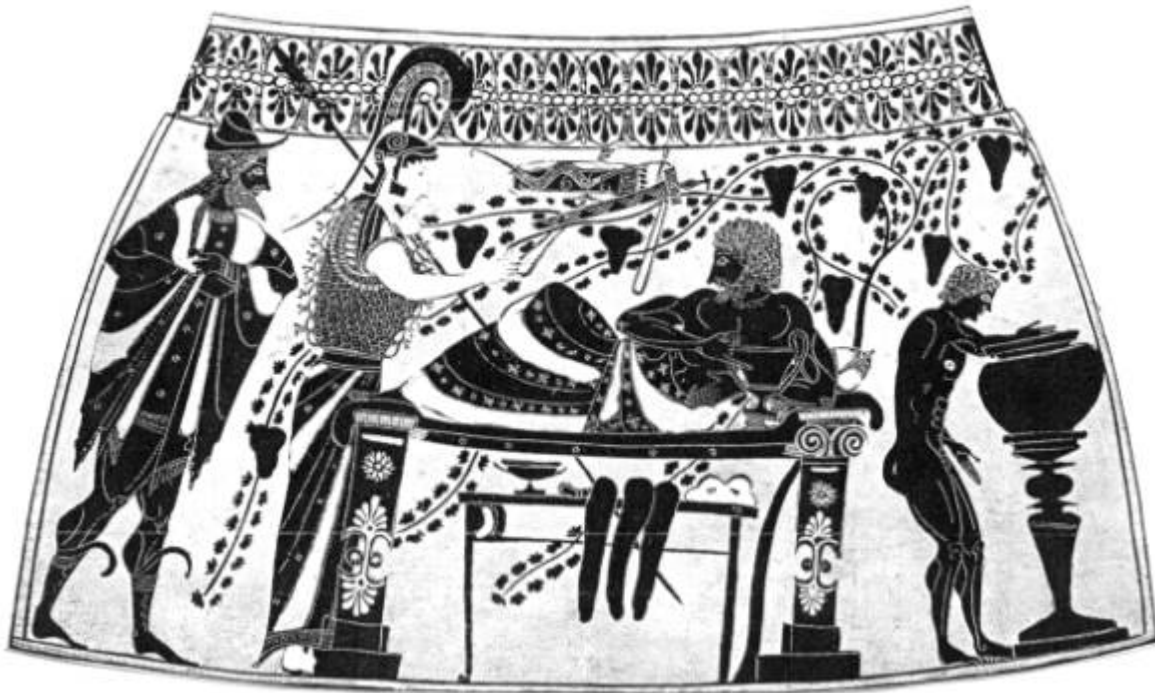
Рис. 4. Пирующий Геракл. Чернофигурная ваза росписи Андокида (по: [Pfuhl, 1923])

Суммируя все вышесказанное, нужно отметить, что термин «князь» применительно к захороненному в Хохдорфе, видимо, не адекватно отражает ситуацию. Лица, похороненные в гальштатских курганах такого ранга, по-видимому, обладали как светской, так и духовной властью, что, в общем-то, характерно для многих народов, находившихся на аналогичной стадии общественного развития. И данные, полученные при изучении других культур и этносов, помогают понять и интерпретировать некоторые артефакты и их связи внутри богатых погребальных комплексов кельтов.