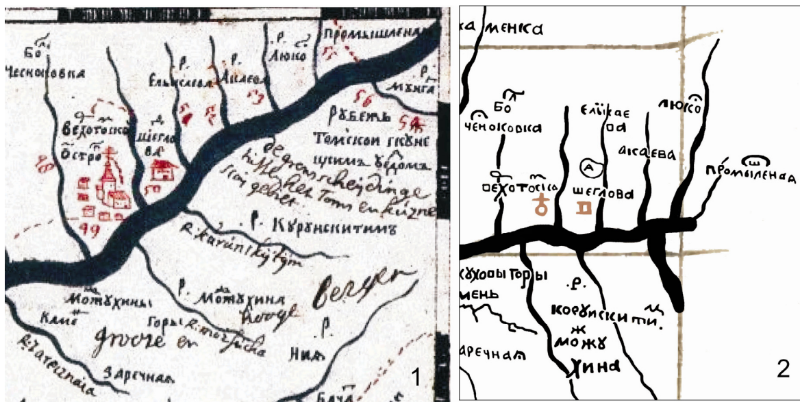
Рис. 1. Южная часть земли Томского города:

Границы между землями Кузнецкого и Томского городов в конце XVII — начале XVIII в. обозначены в чертежах С.У. Ремезова (рис. 1). В «Чертежной книге...» (рис. 1, 1) показан Верхотомский острог (ныне с. Верхотомское Кемеровского района Кемеровской области в 15 км к северу от областного центра). Выше его по Томи показаны д. Щеглова и р. Куруискигим (современная Искитимка), ныне располагающиеся на территории г. Кемерово. В правом верхнем углу близ р. Мунгат имеется надпись: «Рубеж Томской...» (рис. 1, 1). Обратим внимание на то, что между д. Щеглова и устьем Мунгата (где располагался Мунгатский острог, находящийся сейчас в северной части современного районного центра Кемеровской области пос. Крапивинский) русских и инородческих деревень не показано. Зато имеется р. Промышленная (правый приток Томи), название которой свидетельствует о местах ведения каких-то промыслов и, возможно, временных поселениях.