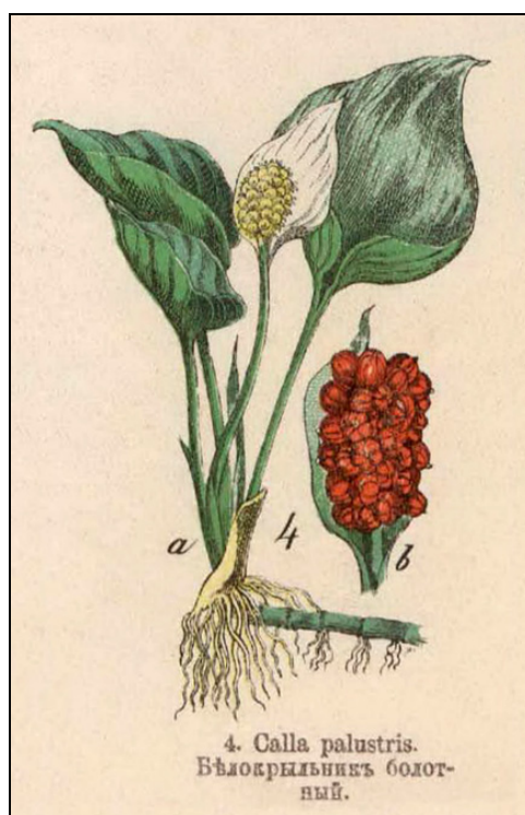
Рис. 2. Белокрыльник болотный в ботаническом атласе конца XIX в. [Вилькомм, 1898, табл. 17]. Fig. 2. Image of Calla palustris in a botanical atlas of the late 19th century [Wilkomm, 1898, tab. 17].

Отдельного внимания в рукописи Я.В. Силина заслуживают сведения об использовании автохтонным населением в пищу некоего корня под названием кас ( хас ). Известно лишь два упоминания об этом растении в публикациях — у Н.А. Миненко (ею приведены данные, подготовленные для того же губернаторского отчета за 1805 г. исправником Березовского уезда) [1975, с. 162] и у А.А. Дунина-Горкавича (вероятно, по материалам его поездок по Среднему Приобью в 1893–1903 гг.) [1911, с. 87]. В обеих работах представлена лишь краткая информация о местном названии корня, времени его сбора и способах приготовления ясачным населением. А.А. Дунин-Горкавич привел также некоторые внешние характеристики корня (форма, цвет, размеры) и упомянул, что вареный кас «заменяет остякам наш картофель» [Там же]. Эти данные довольно редко использовались этнографами — вероятно, ввиду невыясненной видовой принадлежности растения и единичного характера сведений.