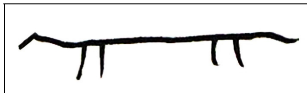
Рис. 1. Тамга представителей Тымской волости с изображением соболя, 1655 г. [РГАДА. Ф. 214, стб. 501, л. 84 об.].