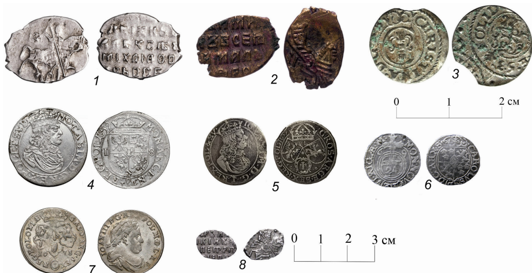
Рис. 3. Образцы монет второй половины XVII в.:

В это время русские вновь прочно устраиваются в устье Оми. Свидетельством чему являются монеты — серебряная и медная копейки Алексея Михайловича 1645–1676 и 1659–1662 гг. (рис. 3, 1, 2). Иностранные монеты представлены солидом 1653 г. (рис. 3, 3), ортом (ортсталером) (рис. 3, 4) и шостаком 1659 г. (рис. 3, 5) и шестаком 1678 г. (рис. 3, 7). Есть в коллекции полторака 1660–1697 гг. (рис. 3, 6) и серебряная копейка Петра I (рис. 3, 8).