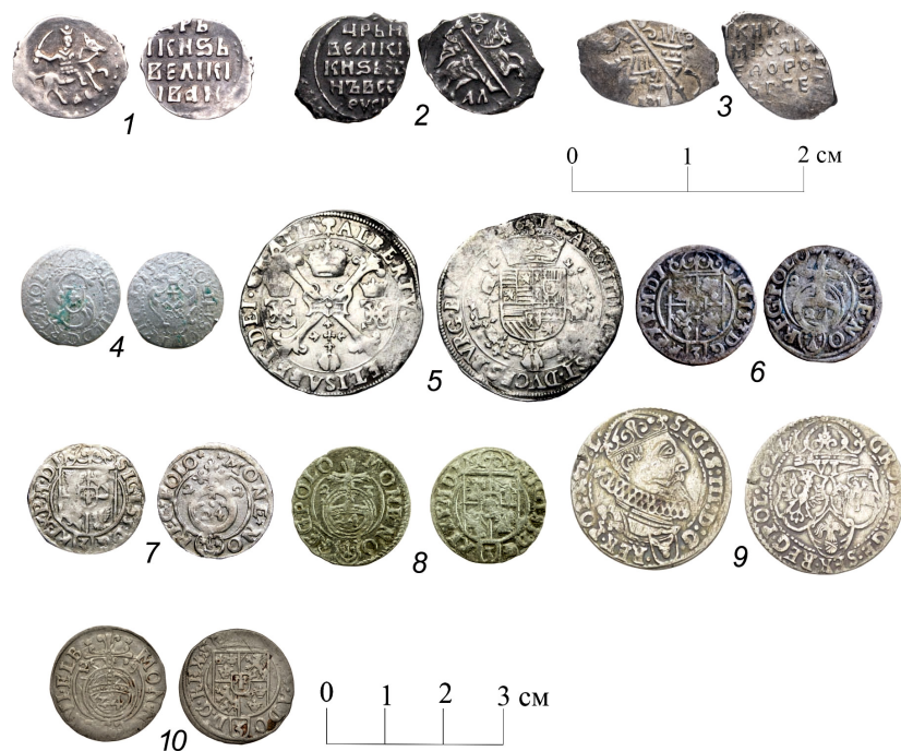
Рис. 2. Образцы серебряных и билонных монет первой половины XVII в.:

рают калмыки, захватившие их лесные угодья, и внести ясак им нечем. Тогда воеводы решили применить силу, и по их приказу с князьков «учели...править... государев ясак напрошлые на три года и били де их правеже разув» [Там же].