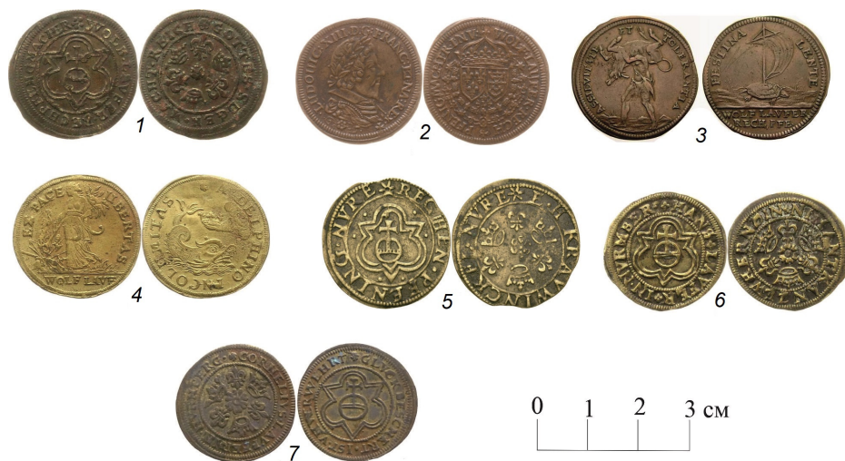
Рис. 4. Нюрнбергские бронзовые счетные жетоны:

1–4 — мастер Вольф Лауффер II (годы работы — 1612–1651); 5 — мастер Ханс Краувинкель III (годы работы — 1586–1635); 6 — мастер Ханс Лауффер (годы работы — 1612–1632); 7 — мастер Корнелиус Лауффер (годы работы — 1637–1688 гг.).