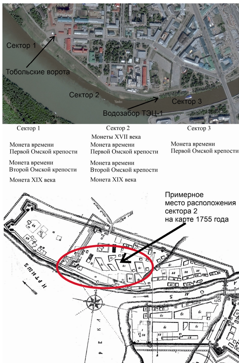
Рис. 5. Место находок монет XVII в. на Яндекс-картах и на карте 1755 г. инженера-подпоручика Михаила Борисова (по: [Палашенков, 1960b, вкладка]). Fig. 5. Location of finds of 17th century coins on Yandex maps and on the map of 1755 by engineer-supporter Mikhail Borisov (after: [Palashenkov, 1960b, tab.]).

Есть основания предполагать, что категория служилых людей, которую называли «литва», была особой. Они отличались от стрельцов и казаков тем, что имели «латы, шишаки и пищали», а в иерархии по окладным, денежным, хлебным книгам их всегда записывали после начальствующего состава: детей боярских, атаманов, сотников [Цветкова, 1994, с. 19]. По мнению Н.Н. Оглоблина, литовцы «сплачивались в дружную общину и сообща отстаивали интересы своего мира: связующими элементами... были... высшая степень культурности... и разные невзгоды сибирской жизни, более чувствительные для иноземцев» [1895, с. 7]. Представители мелкой и средней шляхты, «как правило, были хорошо знакомы с военным делом, многие проходили ранее службу в кавалерии и к тому же отличались достаточно высоким по тем временам уровнем образования» [Гончаров, Ивонин, 2014, с. 90–91].