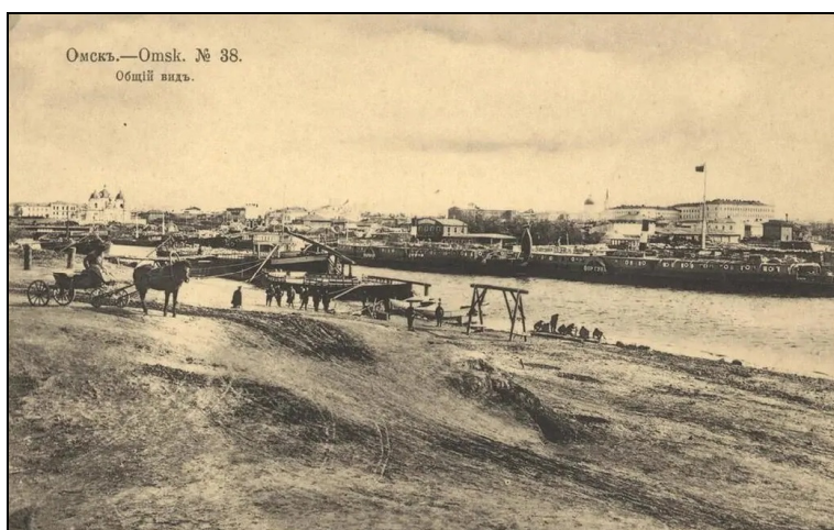
Рис. 6. Устье Оми на фотографии конца XIX в. (из свободных интернет-источников).

В наши дни это место благоустроено и не кажется удобным для причаливания судов. Но на фотографиях конца XIX в. оно выглядит иначе (рис. 6). Это пологий, удобный для подъезда берег с хорошим твердым песком, не заиленный. Течение Иртыша и Оми небыстрое, 3–4 км в час. Поэтому лучшего места для судовой стоянки подобрать было трудно. Этот приустьевый участок Иртыша еще в начале XX в. активно использовался как пристань для речного транспорта.