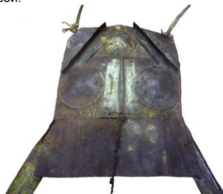
Рис. 7. Верхняя часть нагрудника

Нагрудная часть сделана из трех горизонтально соединенных прямоугольных пластин (рис. 7). К середине верхней из них прикреплены выпуклый жестяной круг (диаметр 7–7,3 см) и по бокам от него два прямоугольника, каждый из которых имеет по середине ребро. На средней пластине размещены два круга и прямоугольник с ребром между ними. С обратной стороны к нижним углам этой пластины приклепаны две жестяные полосы. На одной из них с обратной стороны сохранились красно-черный рисунок неопределенной формы и надпись в две строки черной краской на желтом фоне: «Д...станского Центр. Совета Народного хозяйства». На другой с наружной стороны сохранился неопределенный рисунок зеленого, красного, коричневого и черного цвета и надпись в шесть строк черными буквами: «ПРИГОТОВЛЕНЫ ИЗ ОТБОРНЫХ ФРУКТОВ НА СИРОПЕ ИЗ ЧИСТО...». К этим боковым полосам прикреплена нижняя пластина нагрудной части, имеющая трапециевидную форму. Ее верхние углы и боковые края загнуты. На краю левой стороны сделано сквозное отверстие, в которое продета медная проволока, связывающая ее с боковой полосой.