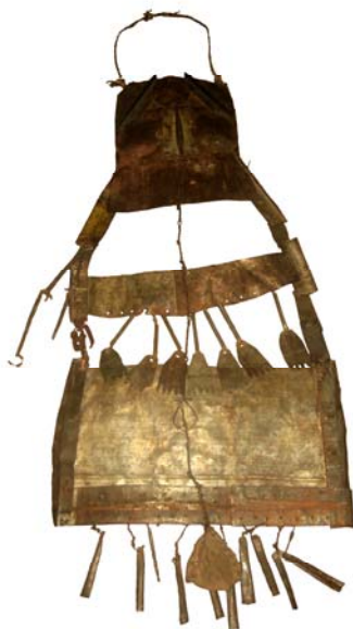
Рис. 6. Шаманский нагрудник из фондов Ямало-Ненецкого окружного музейно-выставочного комплекса им. И. С. Шемановского (г. Салехард) (ОФ № 19)

К одним из наиболее ранних предметов музейно-выставочного комплекса им. И. С. Шемановского относится шаманский нагрудник (№ 19). В музейной документации он значится под названием «нагрудник шамана-ненца», поступившим в 1964 г. (рис. 6). Территория и время его бытования не указаны. Фотография нижней части нагрудника была опубликована в монографии Л. В. Хомич «Ненцы» [1995. С. 241]. Нагрудник изготовлен из пластин, вырезанных из жести, имеет форму неправильной трапеции и состоит из трех частей: нагрудной, поясной и набедренной. Длина нагрудника 91 см, ширина 21–37,5–41,5 см.