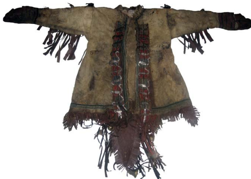
Рис. 1. Шаманский кафтан из фондов Ямало-Ненецкого окружного музейно-выставочного комплекса им. И. С. Шемановского (г. Салехард) (б/н). Вид спереди