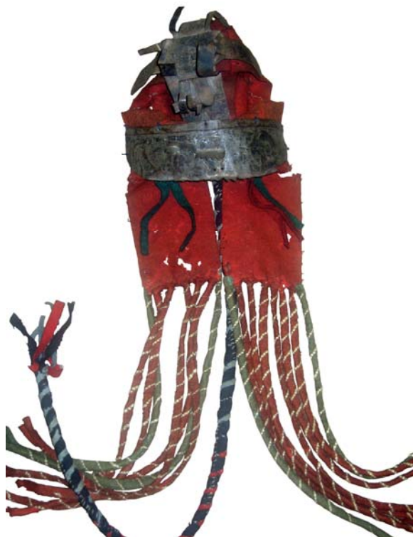
Рис. 9. Шаманский головной убор из фондов Ямало-Ненецкого окружного музейно-выставочного комплекса им. И. С. Шемановского (г. Салехард) (ОФ № 6)

точки скручены и сшиты сухожильной ниткой декоративным швом с подкладкой подшейного волоса оленя. Таким образом слева сделано 6 жгутов, справа — 5. Кроме того, по два таких же жгута, но из зеленого сукна, пришиты по краям. Нижние концы жгутов нарезаны на узкие полоски, которые образуют кисточку. Один жгут из черного сукна с нашитыми на него по спирали полосками голубого и красного сукна и с кисточкой из черного, голубого и красного сукна пришит к заднему шву головной повязки. Кисточки из полосок сукна красного и зеленого цвета пришиты с изнанки к налобной части головной повязки (длина 11 см, ширина 1,5 см).