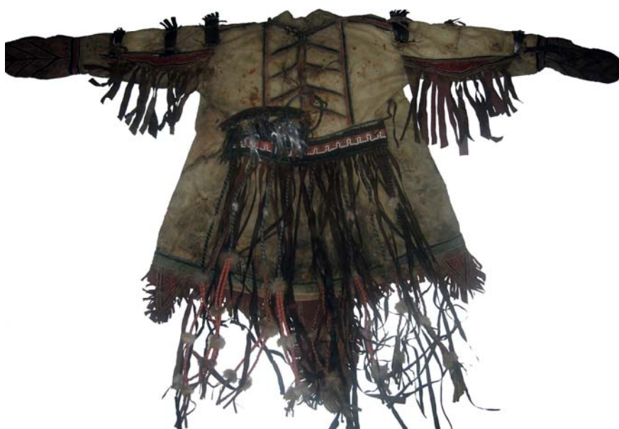
Рис. 2. Шаманский кафтан. Вид сзади

Кроме того, кафтан имеет дополнительно пришитые детали, которые не изменяют его покроя, а скорее являются частью декоративного оформления. Так, клиновидные куски ровдуги нашиты от проймы к обшлагоу на заднюю часть каждого рукава. На поясную часть спинки нашита полоса черной хлопчатобумажной ткани («пояс»), на которую верхним краем пришит прямоугольный кусок черного сукна (40×7 см). К краю подола кафтана прикреплены пять треугольных клиньев («хвостов») из окрашенной в красный цвет ровдуги, из них по одному (7,5×11 см) нашито на нижний край полочек, один — самый большой (27×14 см) — к середине края подола спинки и по одному (7,5×11 см) — по бокам от него.