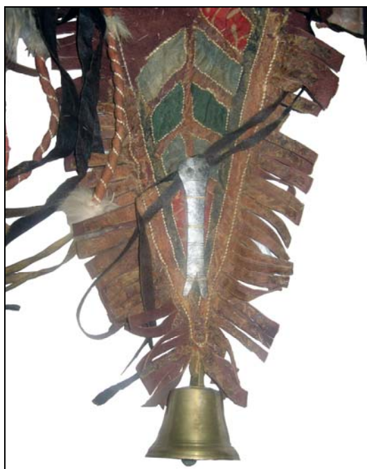
Рис. 5. Оформление большого клина («хвоста»), пришитого к подолу кафтана

Куском красной ткани зашита внутренняя часть клиньев, пришитых к рукавам, и четырех маленьких клиньев («хвостов»), пришитых к краю подола. Ромбовидными кусочками синей, зеленой и красной ткани обшит рисунок на центральном клине («хвосте»), пришитом к краю подола (рис. 5). Прямоугольники красной и синей хлопчатобумажной ткани нашиты с двух сторон от черной линии, проходящей по середине каждой из полос, пришитых к краям полочек. Все полосы, нанесенные краской и выполненные приемом аппликации, сопровождаются вышивкой подшейным волосом оленя.