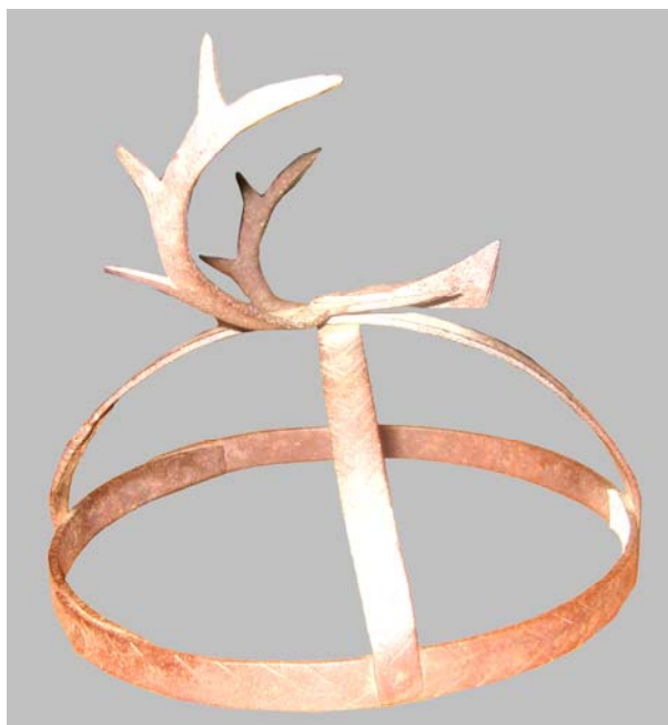
Рис. 10. Шаманская «корона» из фондов Ямало-Ненецкого окружного музейно-выставочного комплекса им. И. С. Шемановского (г. Салехард) (ОФ № 1084)

Следующий предмет из фондов окружного музейно-выставочного комплекса им. И. С. Шемановского — головной убор, записанный как «корона» (№ 1084) (рис. 10). По музейной документации, она поступила в музей в 1980 г. из п. Толька Красноселькупского района ЯНАО, т. е. с территории расселения тазовских селькупов.