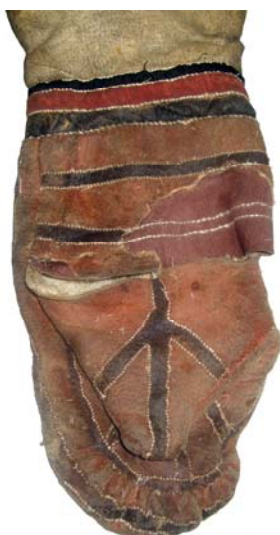
Рис. 4. Декор рукавицы шаманского кафтана

Окрашивание выполнено красной и черной краской. Полностью красной краской окрашены рукавицы, полосы, пришитые к краям полочек, бахрома, а также клинья, прикрепленные к краю подола. Кроме того, полосы красной краски выполнены в центральной части клиньев, пришитых к краю подола. На среднем и самом большом клине такая линия имеет симметричные ответвления. Полоса черной краски окаймляет края рукавов. Черная линия проходит по середине полос, пришитых к краям полочек, на рукавицах (на ладонной и тыльной частях, а также на пальнике с внутренней и внешней стороны) образует рисунок в виде линии с симметричными ответвлениями (рис. 4). Двойной черно-красной полосой очерчены ворот, плечевые швы, края нашитых на рукава клиньев и клиньев, пришитых к подолу. Такие же полосы нарисованы на верхней части спинки кафтана. Здесь они образуют рисунок в виде заключенной между двумя параллельными линиями с симметричными отростками. Вероятно, линия с ответвлениями на рукавицах изображает строение конечностей (лап или рук), а на спинке — строение грудной клетки — ребра и позвоночник.