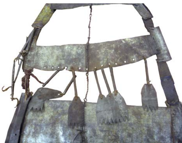
Рис. 8. Средняя часть нагрудника.

Поясная часть составлена из двух пластин, соединенных заклепками (рис. 8). По нижнему краю сделано 14 отверстий. В семь из них продеты ровдужные ремешки с надетыми на них жестяными трубочками и подвесками в виде вырезанных из жести лап животного. Поясная часть соединяется с набедренной с одной стороны при помощи двух кожаных прямоугольников, скрепленных проволокой, с другой — полоской хлопчатобумажной ткани (ситца) коричневого цвета.