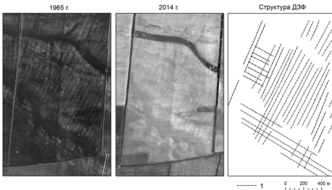
Рис. 2. Формы древнего земледелия на спутниковых снимках сверхвысокого пространственного разрешения, полученных с интервалом 50 лет: 1 — контуры древних земледельческих форм.

Совокупность форм древнего земледелия, выявленная нами на территории исследования на основе описанных в предыдущем разделе критериев, характеризуется выраженными признаками на снимках разных лет (рис. 2).