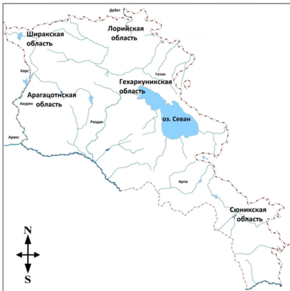
Рис. 1. Современное административное деление Армении.

никской области. Разрозненные и малочисленные материалы (Арцвакар, Сарухан, Кармир) были суммированы в одну краниологическую подборку (табл. 1). Исключен из анализа череп с врожденной ахондроплазией из могильника Арцвакар (погр. 4) [Khudaverdyan, 2016a]. Для анализа отобрано 18 мужских и 11 женских черепов. Была также сформирована отдельная серия черепов с непреднамеренной (затылочно-теменной) искусственной деформацией (табл. 1). Деформация затылка является, по всей видимости, результатом тугого пеленания и нахождения младенца большую часть дня в деревянной люльке («оророце», «бешике»). Следовательно, уплощенность формировалась лишь на первом году жизни под воздействием колыбельной стенки, соприкасавшейся с теменем и затылком. Форма черепа изменена, как правило, незначительно, в связи с чем эта особенность была замечена сравнительно недавно [Khudaverdyan, 2016b].